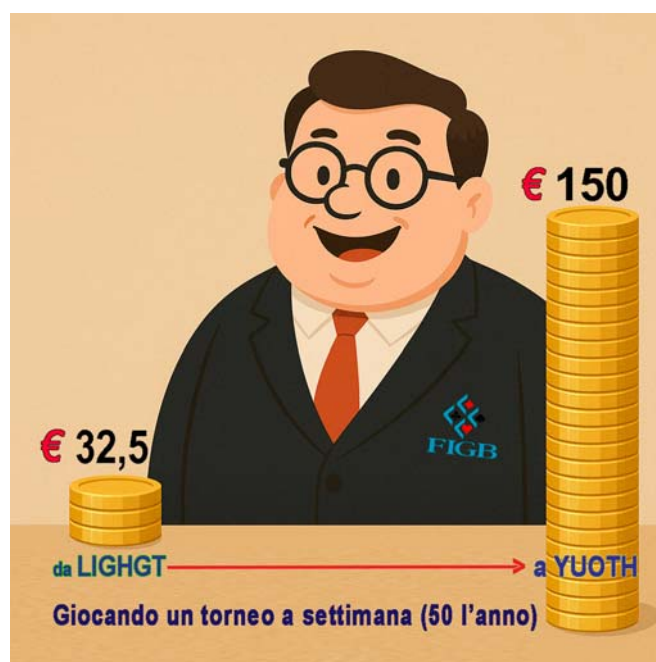
Quote omologazione tornei federali

Per i bridgisti significa costi più alti . Versamenti che, come dimostrano gli ultimi anni, non hanno portato benefici né al bridge italiano né alle ASD.